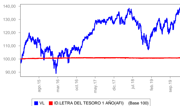
Evolución del valor liquidativo últimos 5 años